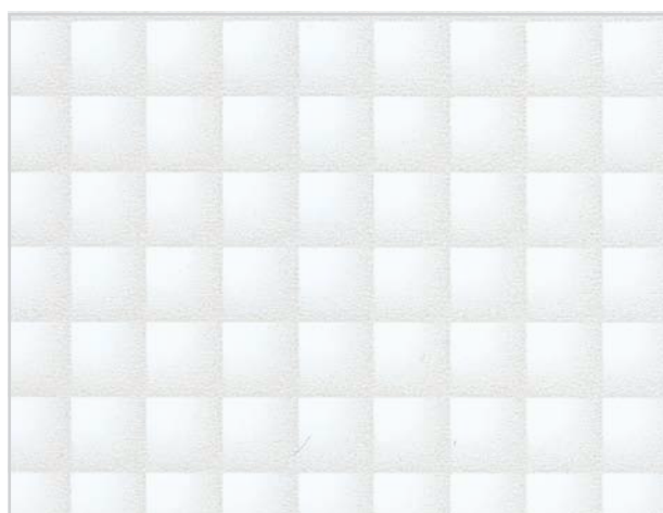
【旧マスホワイト】 マス目約 7mm